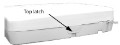
Figure 6. Releasing top latch