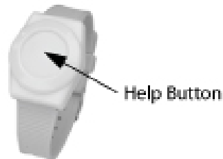
Figure 2. Personal Help Button

Le bouton d'aide personnel sert à activer le panneau de contrôle en cas d'urgence (voir Figure 2).