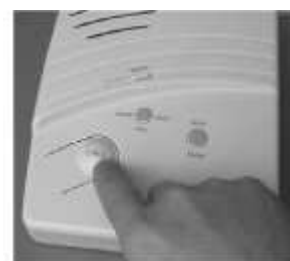
Figure 5. Activating the panel CALL button