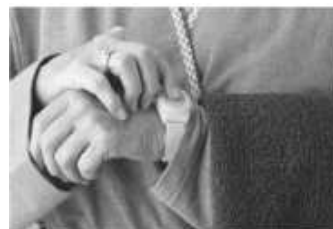
Figure 4. Activating the Personal Help Button

Vous pouvez actionner le dispositif d'alarme en appuyant sur votre bouton d'aide personnel. Le bouton peut être porté au poignet, comme un pendentif, ou à la ceinture.