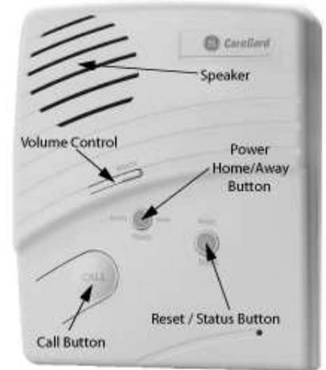
Figure 1. CareGard Panel Front

Quand le couvercle du panneau est fermé, les boutons du panneau font fonctionner le système (voir Figure 1). Quand le couvercle est ouvert, les boutons du panneau servent à régler l'horloge et les rappels de médication.